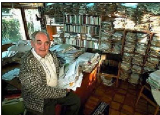
Mogens Glistrup på sitt kontor efter fängelsevistelsen.

Danmark har haft ett populistparti sedan 1973, då Mogens Glistrup bildade Fremskridtspartiet, eller Framstegspartiet (FP). Vid den tidpunkten var Danmark fortfarande helvitt, och invandringen var inte Glistrups huvudfråga. Istället gick han till val på en frihetlig plattform som krävde en 90-procentig sänkning av de offentliga utgifterna, samt ett avskaffande av inkomstskatten. Visserligen tilltalade inte sådana radikalt frihetliga idéer det i huvudsak välfärdsälskande danska folket, men många var så trötta på det politiska etablissemangen att hans parti fick 15 procent av rösterna i valet 1973. FP misslyckades med att vinna stöd för sina idéer i Riksdagen och tappade mark i senare val. Glistrup själv fälldes för skatteflykt, någonting som han upprepade gånger har fängslats för.