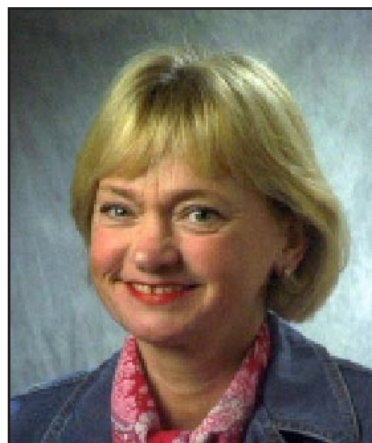
Frispråkiga Pia Kjaersgaard.

Efter 1998 växte partiets popularitet i takt med växande kriminalitet bland invandrare. De grova brotten blev snabbt allt vanligare, speciellt rån och våldtäkt, och hela 68 procent av alla våldtäkter begås nu av invandrare. Då invandrare bara utgör fem procent av befolkningen betyder det att våldtäktsfrekvensen med invandrare som gärningsmän är 40 gånger högre än bland infödda. Liksom i Sverige och Norge är folk från Mellanöstern värst.