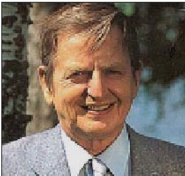
Olof Palme: en stor del av problemet.

Följaktligen tillkännagav moderaterna i början på 2002 att de inte skulle låta honom ställa upp för om-